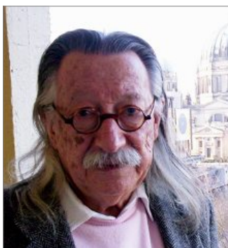
Joseph Weizenbaum 2005

Computer sind erst einmal nichts anderes als Datenträger bzw. Datenspeicher und Datensender